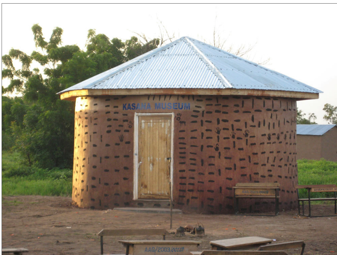
Fig.2. Billede af museumsbygningen i K.M.A.P.(foto: Hanne Nielsen).

fortidslevn. Udstillingens fokus ligger på den store aktivitet, der var i området, da det var grænseland mellem Zambarima-land (muslimsk stamme, oprindeligt fra Niger) og Ashanti-land (den etniske majoritet i Ghana) omkring år 1800, og de traditioner fra den tid, som fortsat holdes i hævd. Museets åbning tiltrak sig stor opmærksomhed fra politikere og medier både lokale, regionale og nationale