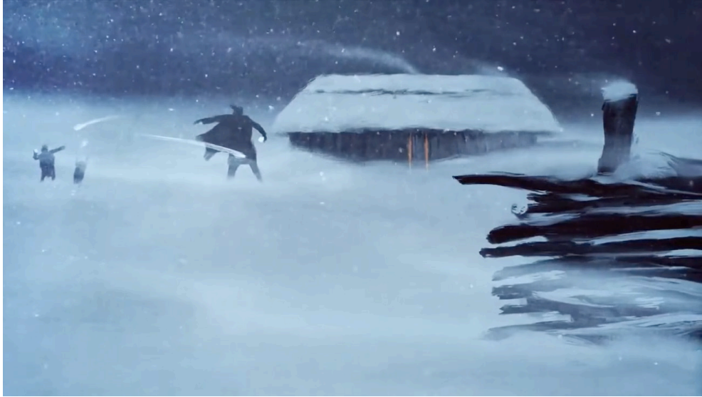
Fig. 1. Den store vikingfar og hans børn får sig er sneboldkamp i udstillingsfilmen År 805 på Kroppedal Museum. Frame grab fra udstillingsfilmen År 805 taget fra Kroppedal Museums Youtubekanal, instr.: Tor Fruergaard, animator/CG-artist: Sune Elskær.

fået lavet udstillingsfilmen af animationsinstruktør og animator Tor Fruergaard og illustrator og art director Sune Elskjær, sidstnævnte med erfaring fra illustrationer til museumsformidling for bl.a. Nationalmuseet. Man har tillige brugt en erfaren manuskriptforfatter, nemlig den Reumert-nominerede dramatiker Thomas Howalt, som blandt andet tidligere har skrevet en række vikingespil og historiske egnsspil.