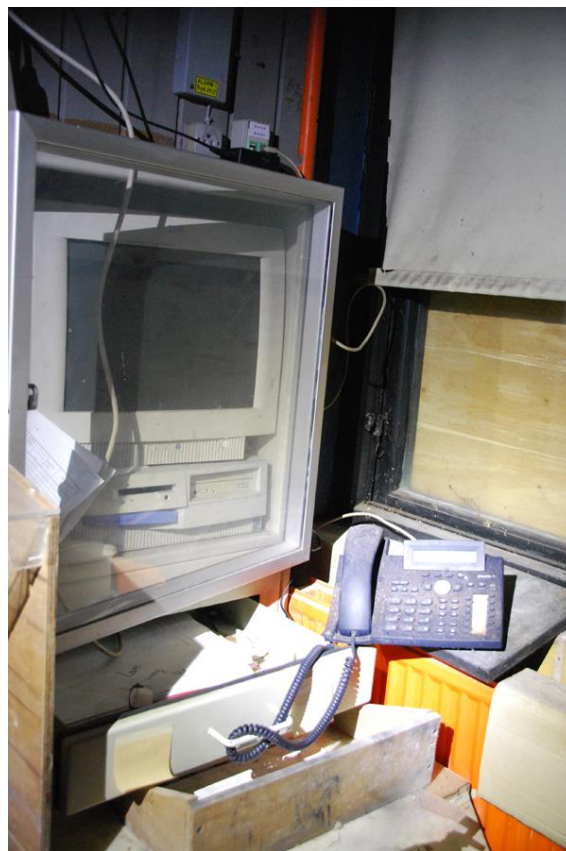
Figur 4: 'Bents rum'.

Jeg vender mig rundt. Tiden og den fugtige luft har krøllet papirerne på opslagstavlen. Et skab står på klem. Jeg ser mig omkring, og åbner lågen. Jeg kigger rundt og rækker hånden ind.... eller nej! En kalender, det er for