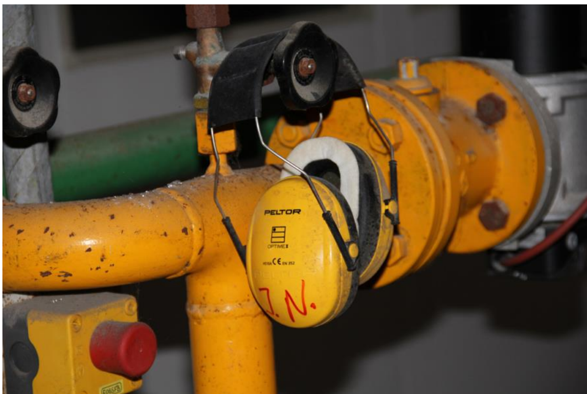
Figur 3: Holmegaard Glasværk. Eksempel på det uberørte.

Det var mit første møde med et samtidsarkæologisk materiale, og jeg havde ingen tidligere erfaringer at trække på i forsøget på at opnå en forståelse af de uberørte kontekster. Der var ingen metodisk håndbog at konsultere, hvorfor jeg i første omgang vendte mig mod velkendte arkæologiske principper og et konventionelt metodeteoretisk redskabssæt: Ved at tegne, fotografere, beskrive, kategorisere og senere analysere materialet ud fra stratigrafiske og topografiske principper dokumenterede jeg dele af det uberørte materiale. Der forelå skriftligt og mundtligt kildemateriale om Holmegaards historie, og resultatet af mine undersøgelser tilvejebragte ingen nye perspektiver, men var primært en materiel bekræftelse på den forhåndsviden jeg havde om stedet, jeg kom ikke en forståelse af det uberørte nærmere. Dette resulterede i en søgen ad alternative metodiske veje i håbet om at tilføre andre dimensioner og opnå den forløsning som de konventionelle metoder ikke umiddelbart formåede at give.