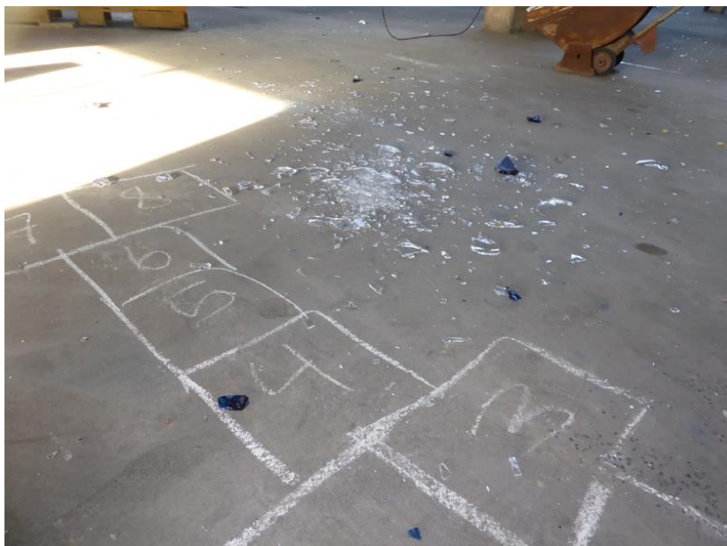
Figur 2: Eksempel på fragmentering og transformation på Holmegaard Glasværk