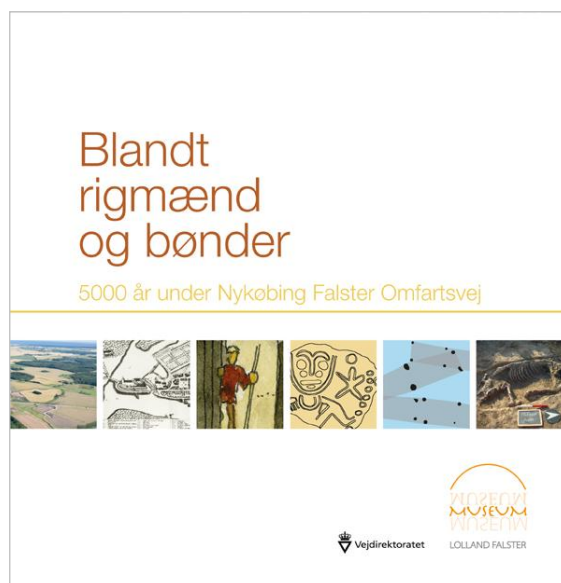
Fig. 1. Forside af bogen 'Blandt Rigmænd og Bønder'.

Centralt i spørgsmålet om en udvidet formidling af udgravningsresultaterne er samarbejdet mellem museum og bygherre. Det er vigtigt at understrege, at der ikke er tale om et modsætningsforhold – tværtimod har begge parter en gensidig interesse i at skabe de bedst mulige resultater sammen, hvilket dog også kræver, at begge parter engagerer sig i opgaven. Samarbejdet er dog i en vis udstrækning dikteret af Museumsloven.