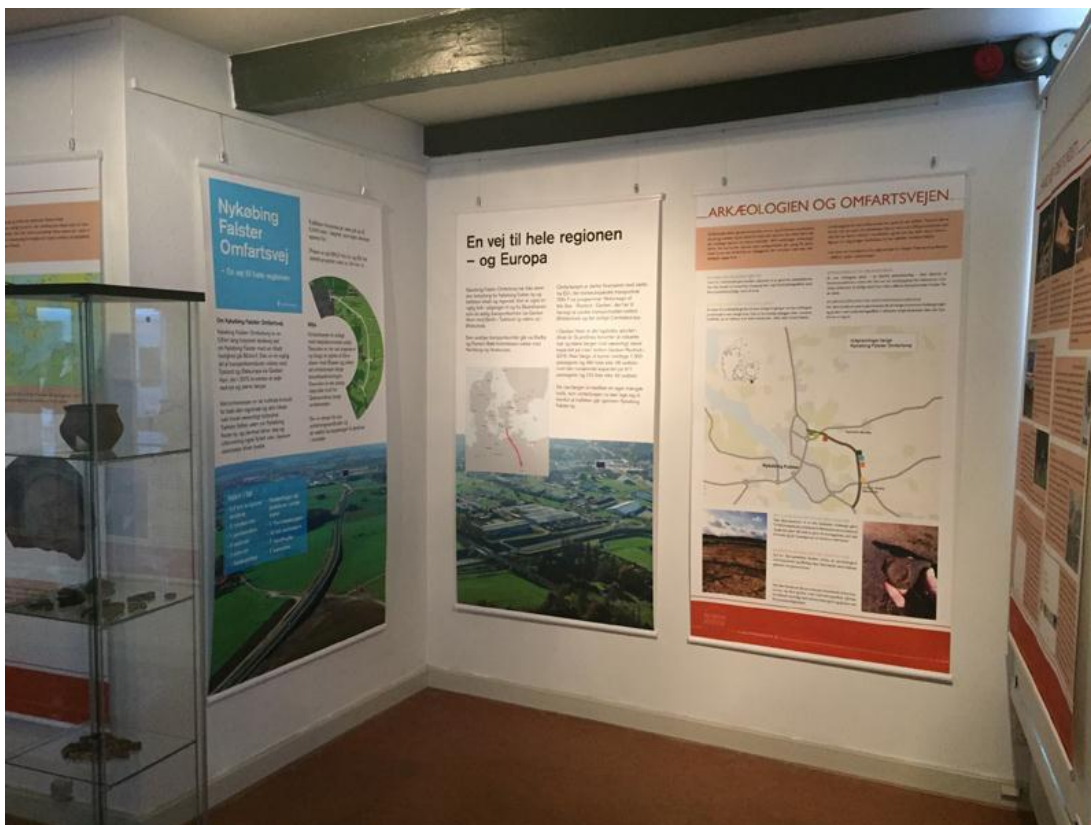
Fig. 3 Særudstillingen 'Vejen til Europa' er en udløber af formidlingsprojektet, som ikke var finansieret af bygherre.

Det er vigtigt at understrege, at ingen af disse udstillinger er en del af det egentlige formidlingsprojekt, og dermed heller ikke har været finansieret af Vejdirektoratet. Alligevel er de en vigtig del af det samlede billede af samarbejdet mellem museum og bygherre, idet begge parter gennem hele forløbet har været bevidste om den gensidige værdi af den videre formidling. Samarbejdet omkring formidlingen af de arkæologiske resultater fra undersøgelserne ved Nykøbing Falster Omfartsvej har dermed på mange måder været et eksemplarisk projekt, hvor både Museum Lolland-Falster og Vejdirektoratet har fået mulighed for at formidle hver deres fortælling om omfartsvejen og dens historie fra oldtid til nutid.